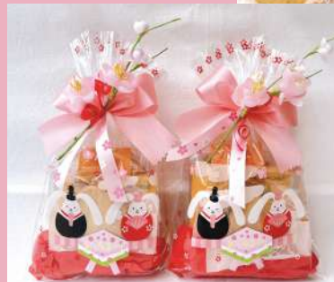
うさひなプレゼント