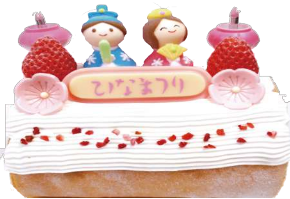
ひなロールケーキ